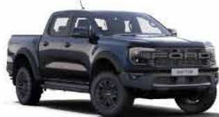
ពណ៌ខ្មៅ / Absolute Black