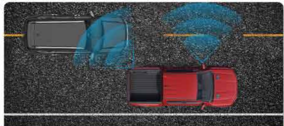
ប្រព័ន្ធគ្រប់ដំណឹងគ្រោះថ្នាក់ផ្នែកចំហៀង និងខាងក្រោយរថយន្ត