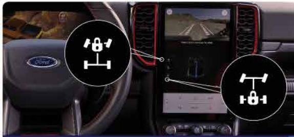
ប្រព័ន្ធថាបម៉ឺងមុខ និងក្រោយសម្រាប់សម្រួលពេលជាប់គុដ *សម្រាប់ម៉ូដែលម៉ាស៊ីនម៉ាស៊ីត ចាប់តែជំរុំក្រោយប៉ុណ្ណោះ