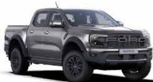
ពណ៌ប្រទេសពណ៌ / Meteor Gray