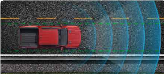
ប្រព័ន្ធជំនួយលើផ្លូវ និងលើកម្រិតបើកបរក្នុងគន្លងគ្រឹមផ្លូវ