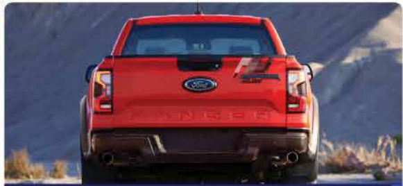
ឃ្នុបខាងក្រោយរចនាថ្មីគ្រួសាររុករានច្រើនប្រភេទ បិទ/បើក មូស្តុម ជាមួយនិងតែមក្សគុស RANGER កាន់តែមានអំណាច