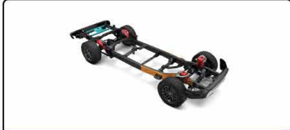
គ្រឿងសំរាប់យន្តឈរលើផ្លូវដែលស្របចំសម្រាប់ប្រើប្រាស់ដើម្បីធានានូវគុណភាព ភាពងឺនឺម៉ា និងសមត្ថភាពគ្រប់គ្រាន់ភាព