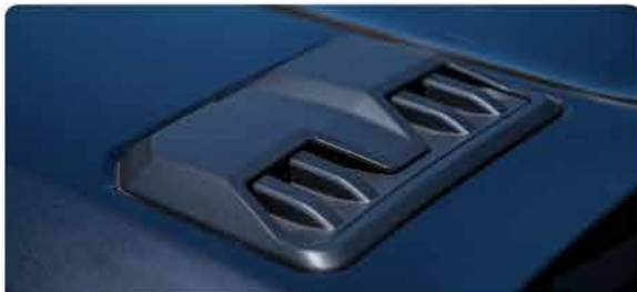
បំពាក់នូវសម្រាប់ខ្យល់ចេញ/ចូលម៉ាស៊ីននៅលើគម្របម៉ាស៊ីនរថយន្ត