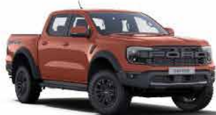
ពណ៌ទឹកក្រូច / Sedona Orange