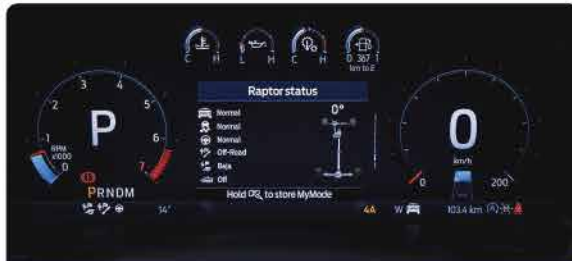
My Mode គឺជាមុខងារអនុញ្ញាតឱ្យអ្នកបើកបរកំណត់មុខងារ ចម្លង ម្លូម និងសម្លេងបំពង់ស៊ីម៉ង់ត៍ក្នុងពេលតែមួយ ពនិងរក្សាសម្រាប់ប្រើប្រាស់ពេលក្រោយ *សម្រាប់តែជម្រើសម៉ាស៊ីនសាំង