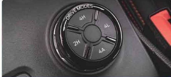
ប្រព័ន្ធគ្រប់គ្រងប៉ុនរថយន្តអេឡិចត្រូនិចជំនាន់ថ្មី (2H, 4H, 4L, 4A)