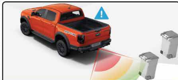
ប្រព័ន្ធចាប់ប្រៀងបន្ទាន់ពេលសម្រាយដោយស្វ័យប្រវត្តិ