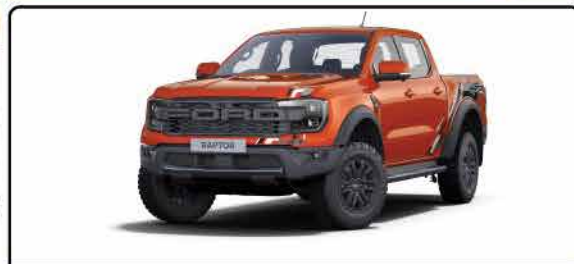
តែមធ្យមមួយជុំវិញរថយន្តធ្វើឲ្យរថយន្តកាន់តែមានអំណាចសម្រាប់តែចម្រើនម៉ាស៊ីនសំរឹម