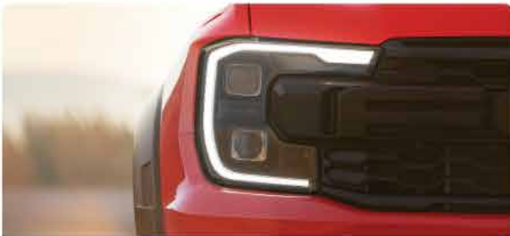
ចង្កៀងខាងមុខរចនាថ្មី C-Clamp ដែលរចនាចេញចាកអក្សរ C ប្រភេទ LED និងចង្កៀងបំភ្លឺពេលថ្ងៃ