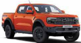
ពណ៌ក្រៃពេក / Code Orange