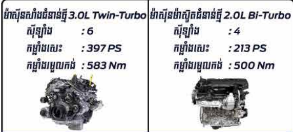
ជម្រើស ម៉ាស៊ីនសំរាប់ និងម៉ាស៊ីនម៉ាស៊ីតម៉ូតូ