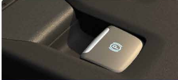
ប្រព័ន្ធប្រឡាំងដៃអេឡិចត្រូនិច