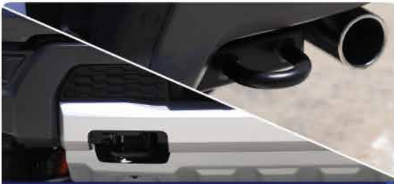
ដៃកសររូបរាងផ្នែកខាងមុខ និងផ្នែកខាងក្រោយ