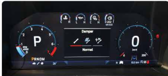
ប្រព័ន្ធកំណត់សម្លេងចរាចរណ៍ : Quiet, Normal, Sport, Baja *សម្រាប់តែជម្រើសម៉ាស៊ីនសាំង