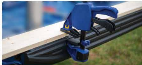
ទ្រុសសម្រាប់ក្តាប់ជាមួយឧបករណ៍គ្រឿងឈើ និងមានបន្ទាត់ម៉ែត្រក្រិត