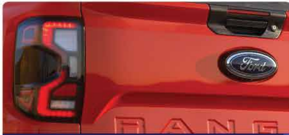
ចង្កៀងផ្នែកខាងក្រោយជាប្រភេទ LED សើរីថ្មី និងបានបន្ថែមស្តុប ចំកណ្តាលខាងក្រោយដែលផ្តល់ពន្លឺភ្លឺ និងសុវត្ថិភាពជាងមុន