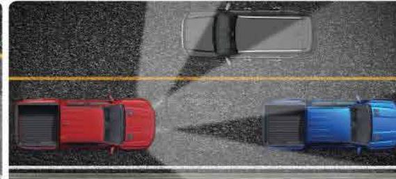
ប្រព័ន្ធផ្សៀងគ្នាគ្រោះថ្នាក់ដែលអាចបែងចែកគន្លងដោយស្វ័យប្រវត្ត