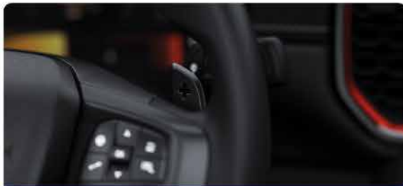
មុខងារបញ្ជូលលេខនៅលើផែនចម្លង (Paddle Shift)