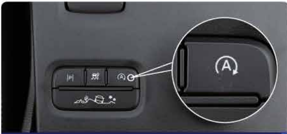
ប្រព័ន្ធន្ទត់ម៉ាស៊ីនដោយស្វ័យប្រវត្តិពេលឈប់ស្តុប (Auto Start-Stop)