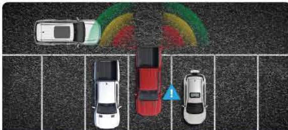
ប្រព័ន្ធគ្រប់សញ្ញាគ្រោះថ្នាក់ពេលសម្រាយ