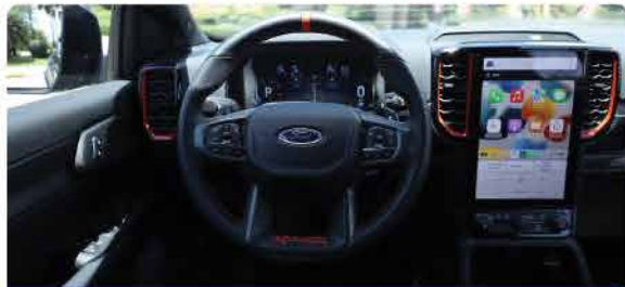
ចម្លងមួយអេឡិចត្រូនិករចនាម៉ឺនឌីជីថលនៃកាត់តែងាយស្រួលបង់បែន (EPAS)