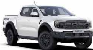
ពណ៌ស / Arctic White