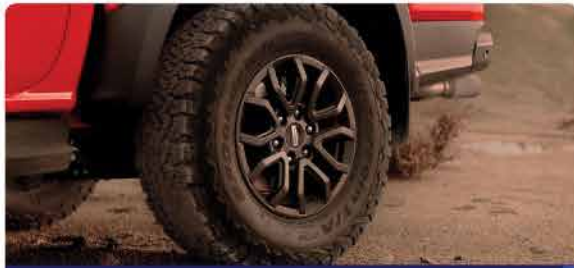
យ៉ាងកង់អាណុយមីញ៉ូមទំហំ 17 អ៊ីញសម្រាប់ប្រើប្រាស់ដើម្បីធានានូវគុណភាព Off-Road ទំហំ 33 អ៊ីញផ្តល់នូវភាពងឺនឺម៉ាគ្រប់គ្រាន់ភាព