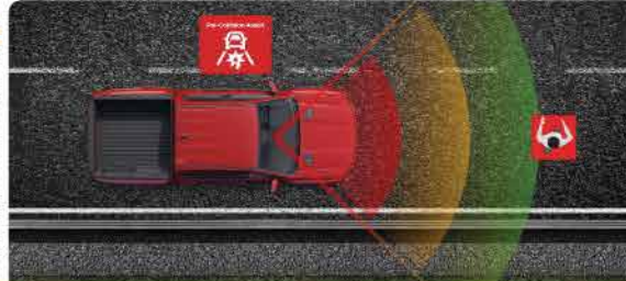
ប្រព័ន្ធគ្រប់គ្រងគម្លាតគ្រោះថ្នាក់ពេលមានឧបសគ្គ ឬអ្នកធ្វើដើរឆ្លងកាត់ និងប្រព័ន្ធធាប់ប្រឡាំងបន្ទាន់ដោយស្វ័យប្រវត្ត