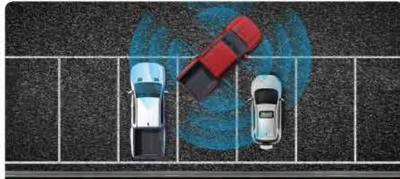
ប្រព័ន្ធថ្មីនួយចូលចតដោយស្វ័យប្រវត្តិបែបអក្ស (T)