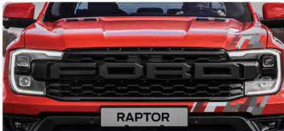
ពាក់រាងផ្នែកខាងមុខបំពាក់ជាមួយនិងអក្សរ FORD គុស ចំកណ្តាលបង្ហាញពីភាពអង់អាចឆន់វែងមាំ