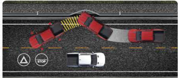
ប្រព័ន្ធចាប់ប្រៀងបន្ទាន់ដោយស្វ័យប្រវត្តិ ក្រោយពេលមានការប៉ះទង្គិច