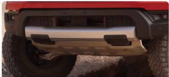
ខែលដៃកែច្នៃបិសេសការពារផ្នែកខាងក្រោម