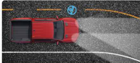
ប្រព័ន្ធផ្សៀងគ្នាគ្រោះថ្នាក់ដែលអាចរកឃើញឧបសគ្គដោយស្វ័យប្រវត្ត