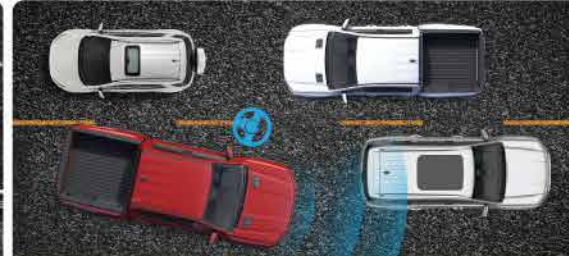
ប្រព័ន្ធគ្រប់គ្រងគម្លាតគ្រោះថ្នាក់ពេលមានឧបសគ្គ និងប្រព័ន្ធជំនួយលើផែនដីស្របច្រកស្រាវជ្រាវគ្រោះថ្នាក់