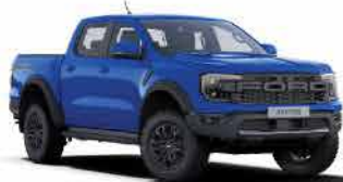
ពណ៌ខៀវ / Lightning Blue