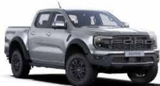
ពណ៌ទឹកក្រាត់ / Aluminium Metallic