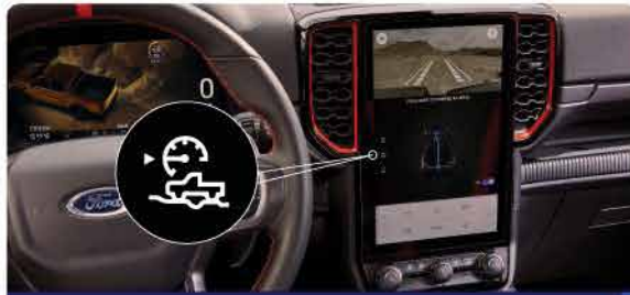
ប្រព័ន្ធកំណត់ និងគ្រប់គ្រងការបើកបរសម្រាប់ឆ្លងទន្លេឧបសគ្គ