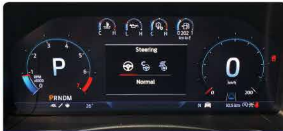
មុខងារកំណត់ការប្រើប្រាស់ចម្លងចរាចរណ៍ : Normal, Comfort, Sport *សម្រាប់តែជម្រើសម៉ាស៊ីនសាំង