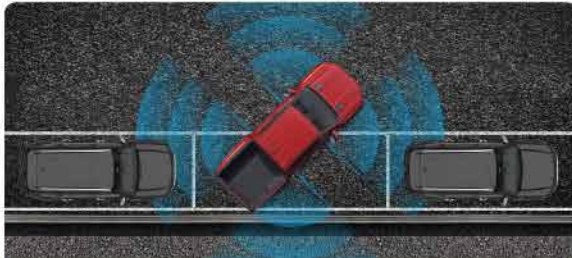
ប្រព័ន្ធថ្មីនួយចូលចតដោយស្វ័យប្រវត្តិបែបអក្ស (P) និងប្រព័ន្ធថ្មីនួយចាកចេញពីចំណតដោយស្វ័យប្រវត្តិ