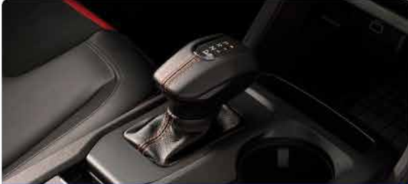
ប្រអប់លេខអេឡិចត្រូនិចជំនាន់ថ្មី 10 គ្រឿង (E-Shifter)