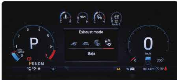
ប្រព័ន្ធកំណត់សម្លេងចរាចរណ៍ : Quiet, Normal, Sport, Baja *សម្រាប់តែជម្រើសម៉ាស៊ីនសាំង