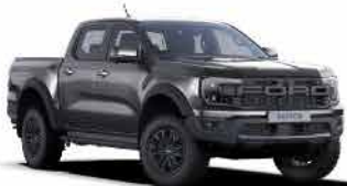
ពណ៌ប្រទេសស្អាត / Conquer Gray