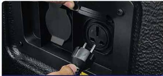
គ្រឿងសំរាប់ប្រើប្រាស់ប្រភេទទំនើបបំផុតសម្រាប់ប្រើប្រាស់ដើម្បីធានានូវគុណភាព ប្រើប្រាស់ប្រភេទទំនើបបំផុតសម្រាប់ប្រើប្រាស់ដើម្បីធានានូវគុណភាព