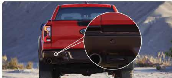
ទ្រុសសម្រាប់ក្តាប់ជាមួយឧបករណ៍គ្រឿងឈើ និងមានបន្ទាត់ម៉ែត្រក្រិត