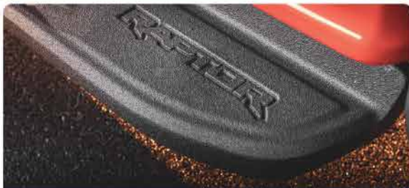
ឈ្មួញចាត់ដើងងាយស្រួលឡើងចុះរថយន្ត និងមានអក្សរស្រាវជ្រាវ Raptor