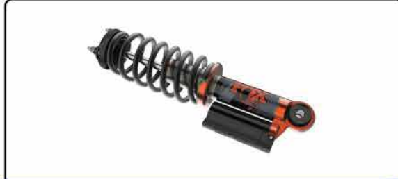
ប្រភេទ FOX ទំហំ 2.5 អ៊ីញ ប្រភេទ Live-Valve សម្រាប់ជម្រើសម៉ាស៊ីនសំរាប់ និងប្រភេទ FOX RACING SHOCKS សម្រាប់ជម្រើសម៉ាស៊ីនម៉ាស៊ីត