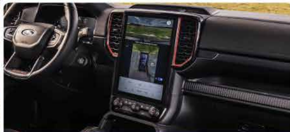
ប្រព័ន្ធតារម៉ៅ 360 ដឺក្រេកម្រិតខ្ពស់ជុំវិញរថយន្ត